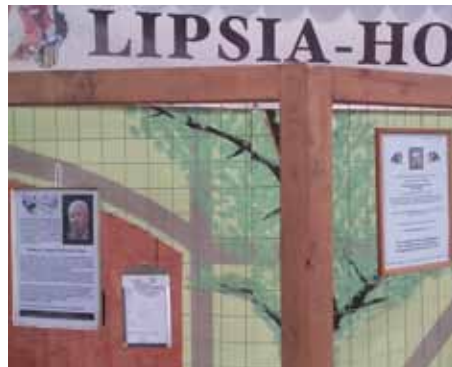
Die Nachrufe an der Voliere in Leipzig