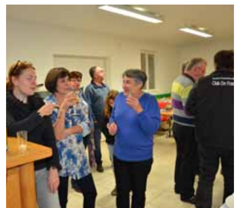
Züchterfreunde beim Abschiedsdrink

dervereins und der Aussteller für die hervorragende Betreuung und Aus-führung der Schau bei den französischen Züchterfreunden nochmals ganz herzlich für diese Leistung bedanken.