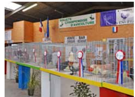
Championtiere der Schau