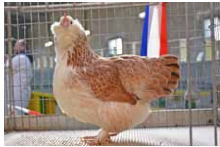
Zwerglachshenne, Best of Show

blaulachsfarbige mit 1 x 97 V, 1 x 96 hv, 2 x 95, 1 x 94, 2 x 92 und 1 x 91 Punkte waren die Noten bei den lachsfarbigen und 1 x 96 hv, 4 x 94, 1 x 93, 1 x 92 und 1 x 0 (zu schwer ohne Bewertung) waren die Noten bei den blaulachsfarbigen. Er wurde Europa-Champion und stellte das beste Tier der Schau. Somit konnten die Aussteller vom SV