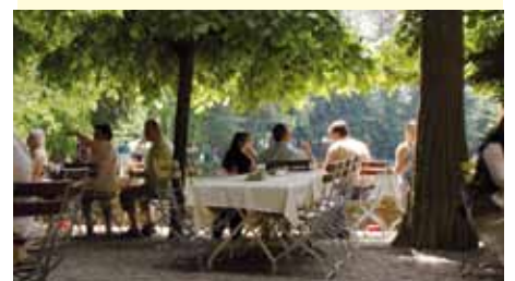
Biergarten Hotel-Gasthaus Dammenmühle