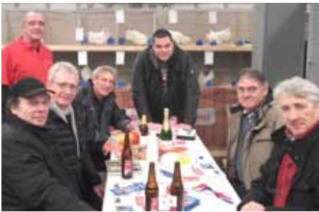
Lachshuhnzüchter in Erfurt