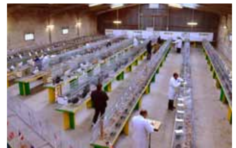
Blick in die Halle beim Bewerten

Ausgestellt waren insgesamt 55 Große und 39 Zwerglachshühner. Die 55 Großen teilten sich auf in 17,17 lachsfarbige, 2,4 weiße, 3,7 weiß-schwarzcolumbia und 3,2 blaulachsfarbige. Die 51 Zwerglachshühner teilten sich in 13,26 lachsfarbige, 3,5 blaulachsfarbige und 2,2 gesperrbarte (Faverolles allemande naine coucou). Letztere sind in Deutschland nicht anerkannt.