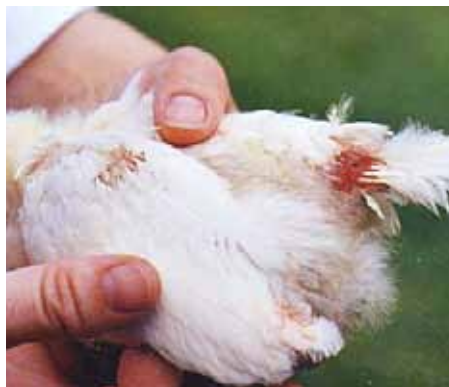
Federpicken in der Kükenaufzucht

Die tägliche Futteraufnahmemenge von Hühnern wird hauptsächlich über die Energiekonzentration begrenzt. Je höher der Energiegehalt, desto weniger müssen die Tiere fressen, um den täglichen Bedarf zu decken. Wenn nun die anderen Inhaltsstoffe, wie Mineralien, Eiweiß oder Rohfaser nicht durch die Futteraufnahme gedeckt werden können, entstehen Unterversorgungen der Tiere, die zu Federpicken führen können, da die Tiere Quellen suchen, aus denen sie diese Unterversorgungen decken können. Dazu zählen zunächst ausgefallene Federn und später auch die Federn der Artgenossen. Ein Stall in dem keine Federn liegen ist also ein schlechtes Zeichen. Ein weiterer Faktor der Futteraufnahme ist die benötigte Zeit, um des täglich benötigte Futter zu fressen. Wenn der Vorgang des Fressens mehr Zeit pro Tag benötigt, bleibt weniger Zeit um Fehlverhalten zu entwickeln. Die Aufnahmezeit kann durch die Darreichungsform, als Pellet oder in Mehlform verändert werden. Pellets können schneller gefressen werden als Mehl. Aber auch des bereitstellen von Heu, Stroh oder Schnüren aus Naturfaser geben den Hühnern die Möglichkeit Fasern aufzunehmen. Diese Fasern füllen dann den Verdauungstrakt der Tiere. Und wer kennt es nicht, mit vollem Bauch ist man zufrieden.