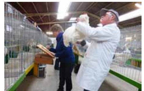
Ein französischer Preisrichter mit Frau

ein deutschsprechender Zuchtfreund der Franzosen die Zeit genommen und hat mir die Übersetzungen gemacht. Dabei erklärte er mir auch, was die gelben Blankokarten an den Käfigen, auf denen nur eine Zahl wie z.B. 1.900 stand, bedeutet. Die französischen Zuchtfreunde wiegen alle Tiere bevor mit dem Richten begonnen wird. Das Gewicht steht auf diesen eben genannten Karten. So also stand auf der Bewertungskarte bei meinem blaulachsfarbigem Zwerghahn „zu schwer, keine Bewertung“.